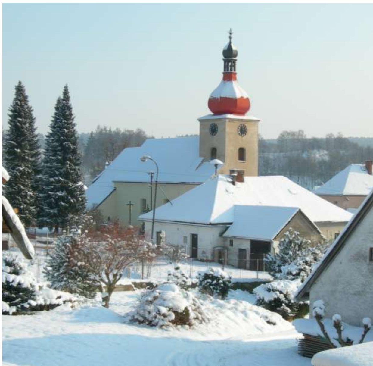
BOHDANEČ – kostel Zvěstování Páně