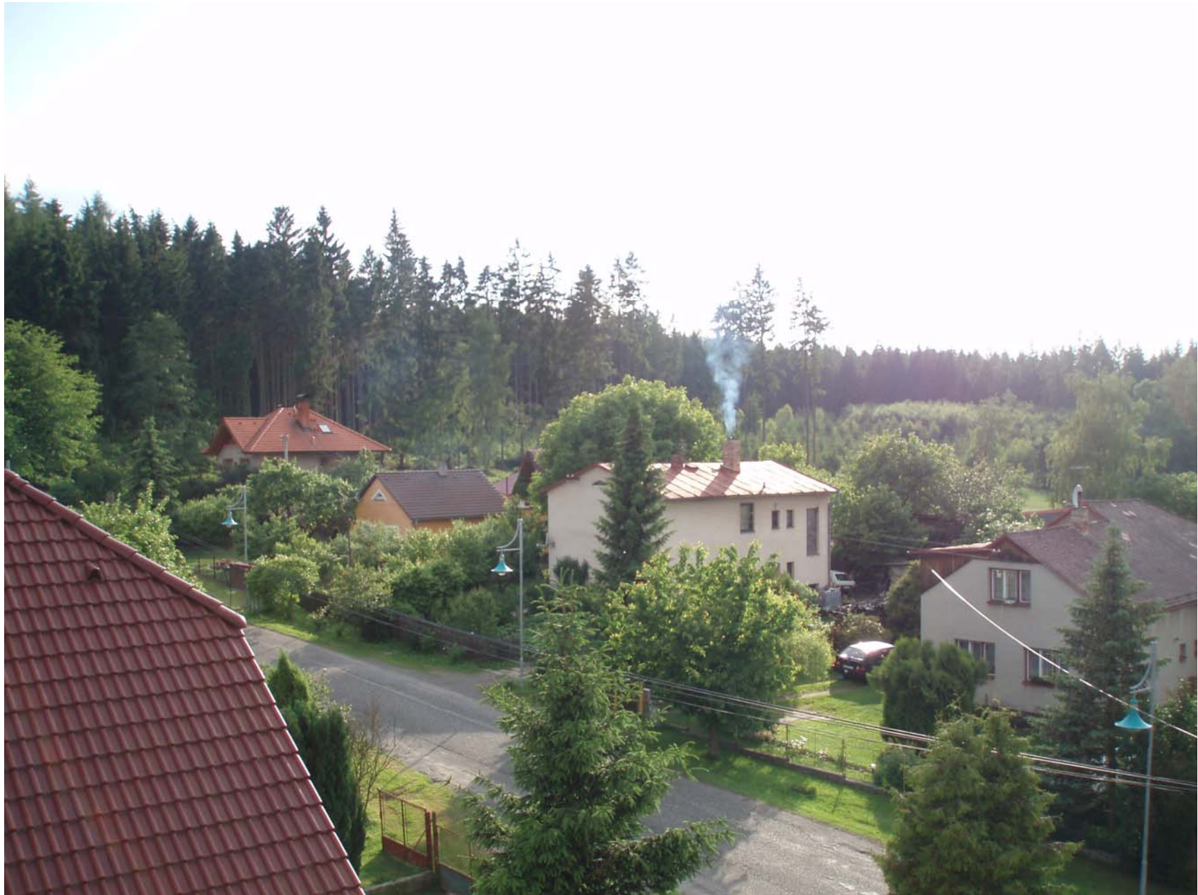
Pohled na horní část Tasic