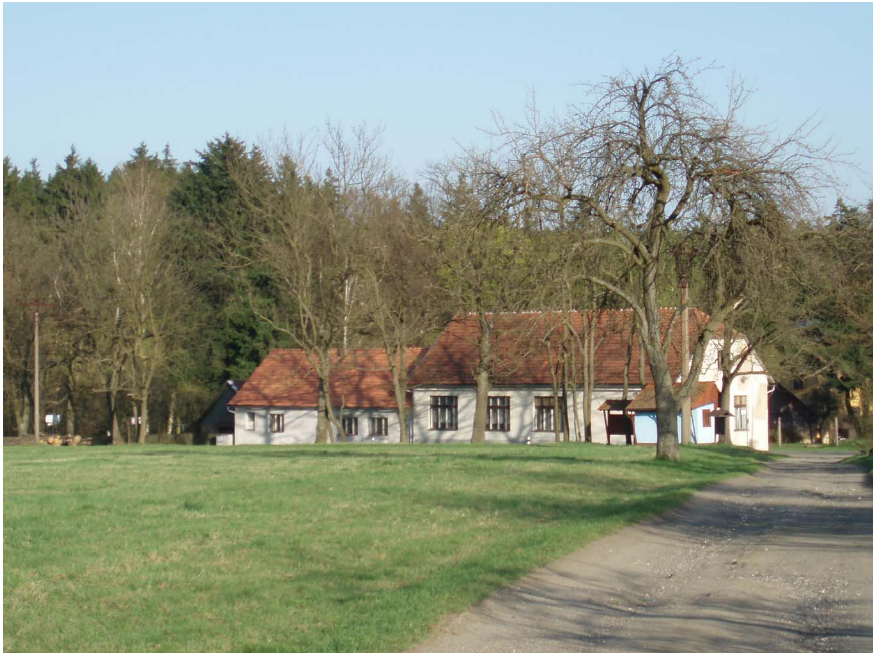
Budovy patřící ke sklárně-dříve také kulturní dům