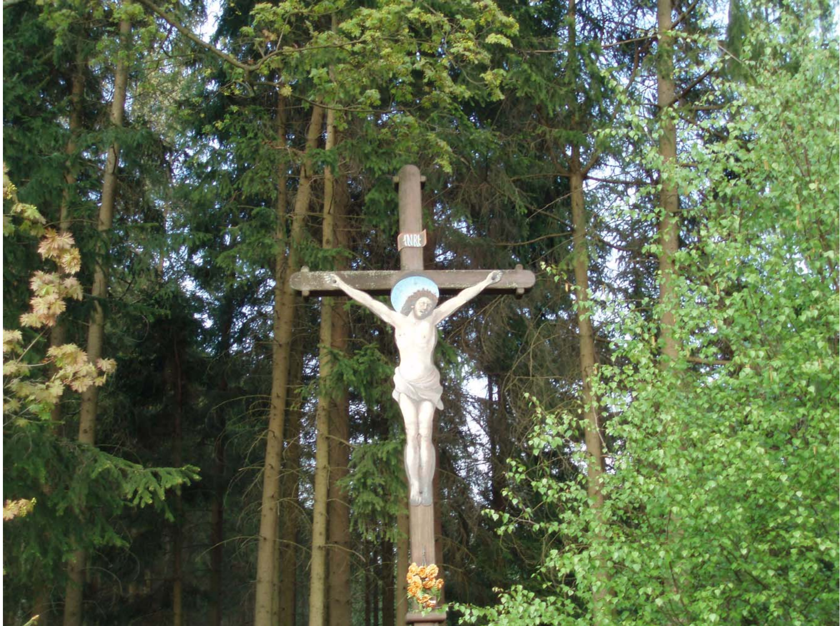
Kříž-opraven a znovu vysvěcen v roce 2000