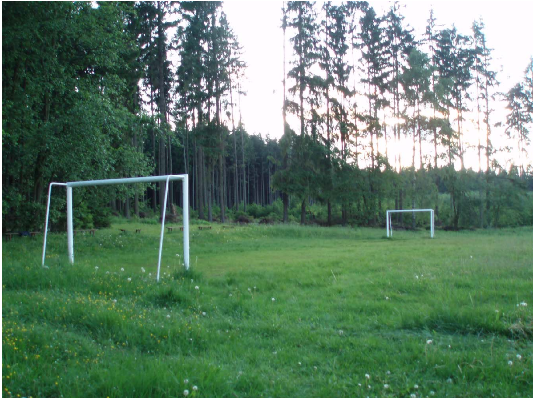
Tasická fotbalová aréna