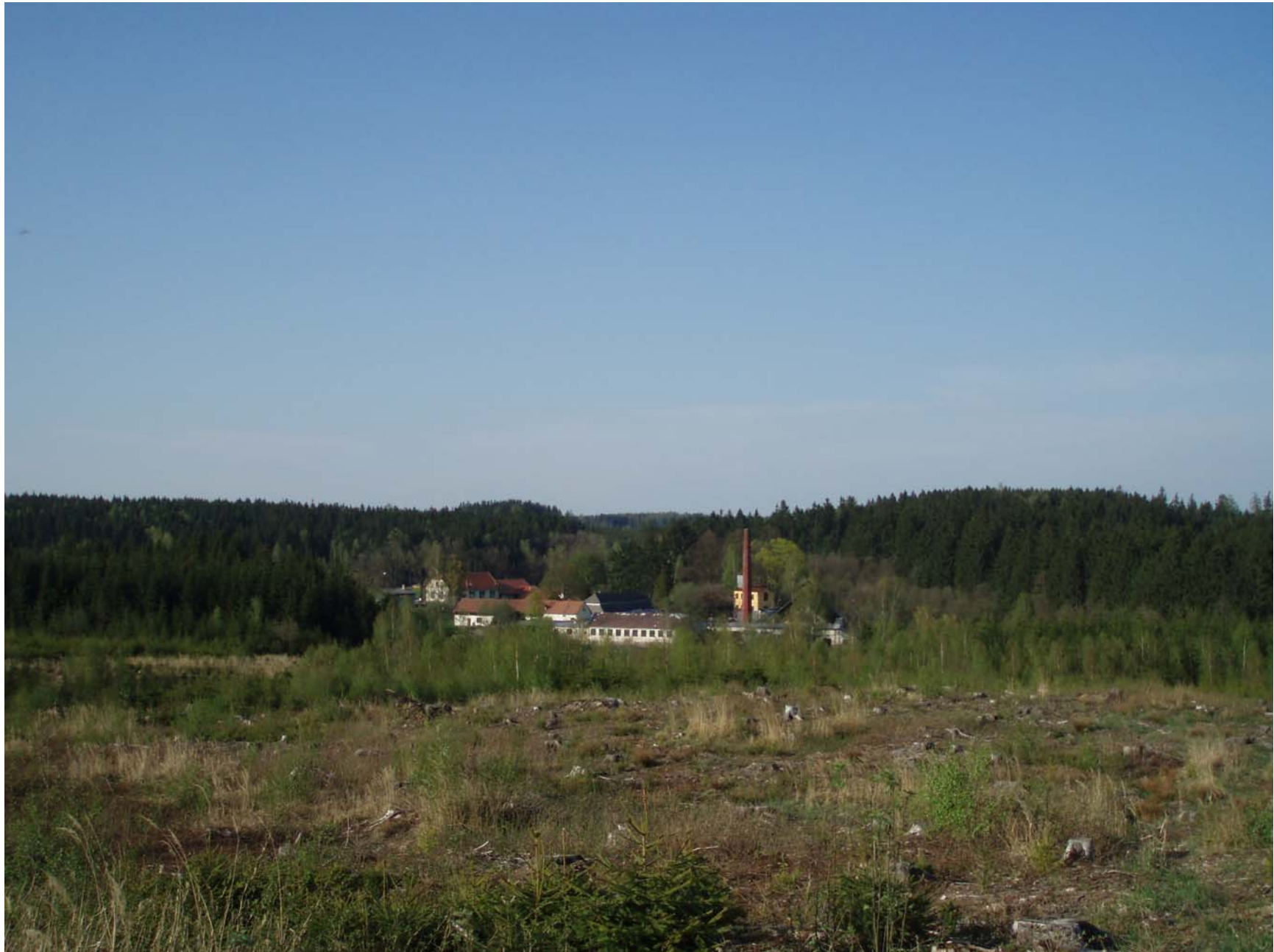
Areál sklárny – nyní skanzen