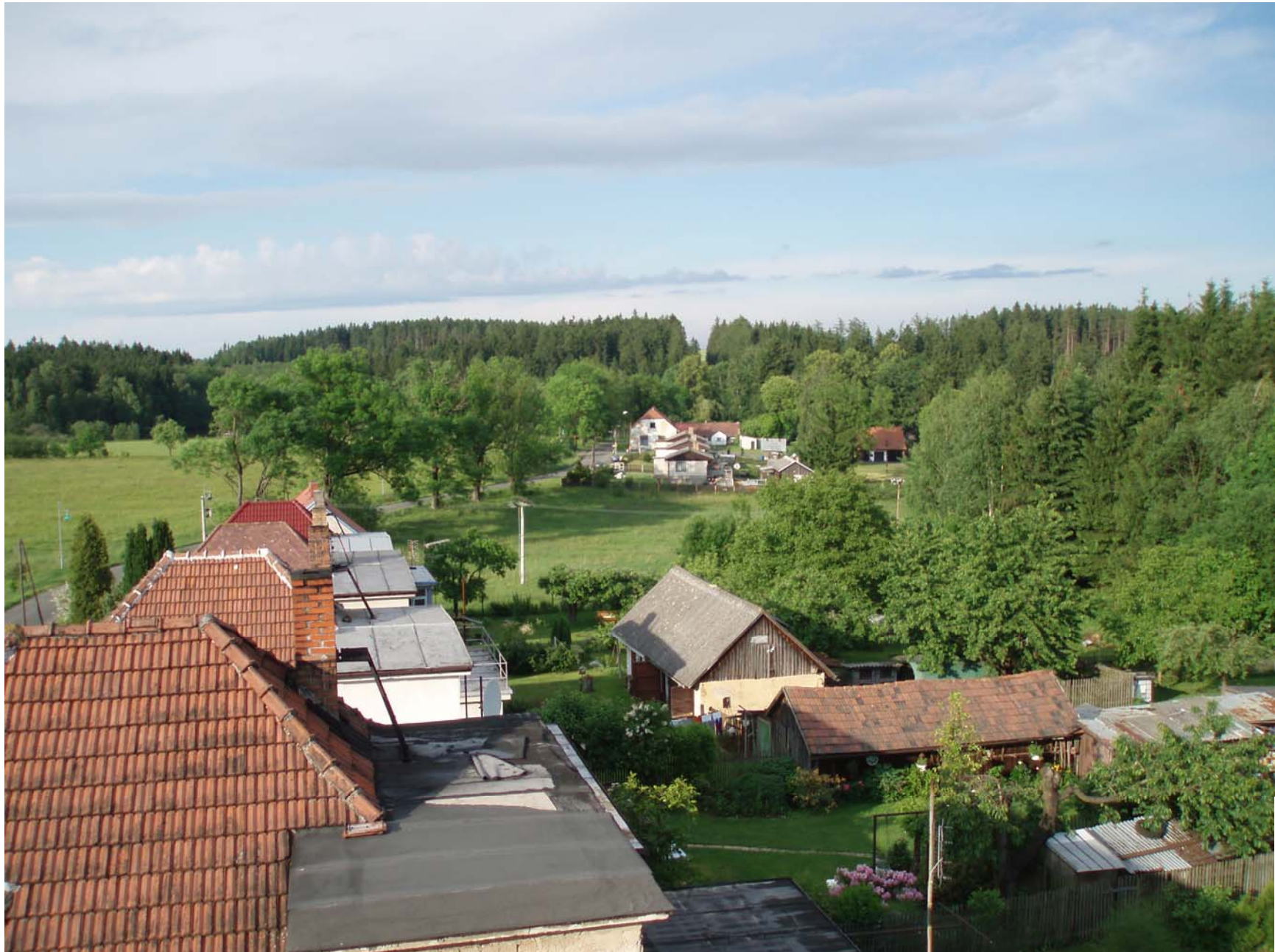
Pohled na dolní část Tasic