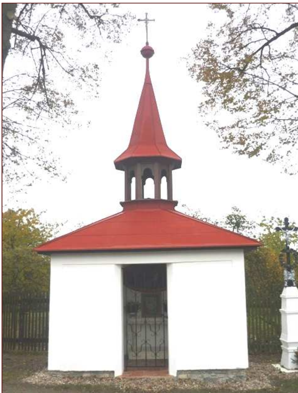
ŠLECHTÍN - kaple Všeck svatých