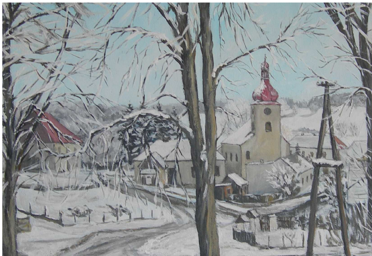
obrázek kostela a fary v Bohdančíně maloval pan Pavel Pícha

Vybavení kanceláře Obecního úřadu výpočetní technikou – Zajištěním dotace z evropského fondu pro regionální rozvoj byla vybavena kancelář obecního úřadu potřebnou výpočetní technikou pro zajištění provozu Českého podacího ověřovacího informačního národního terminálu tzv. Czech Point, kdy dotace pokryla 80 % celkových nákladů. Dvaceti procenty se na vybavení kanceláře podílela obec Bohdaneč.