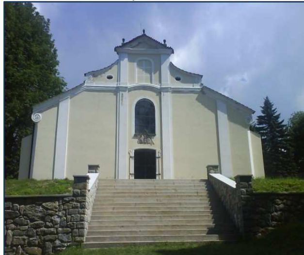
Čelný pohled na vchod kostela