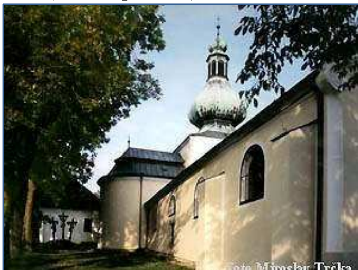
Křemešník, pohled na kostel a v pozadí Kalvárie

Další výlety-poutě dá-li Pán Bůh a dle zájmu podnikneme opět na jaře, včas dáme vědět jak ve Zpravodaji, tak v ohláškách v kostele, nebo na vývěsních tabulích. AL