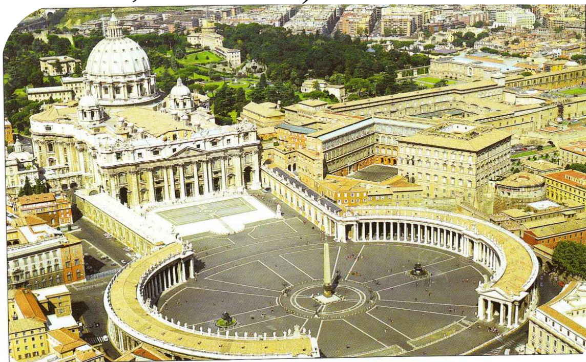
Řím, Vatikán, chrám Svatého Petra a náměstí, ve tvaru klíče