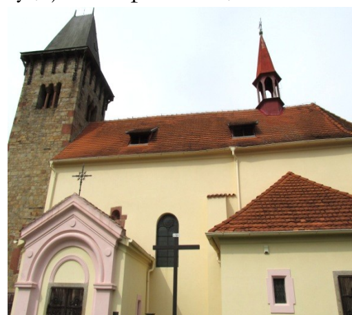
Kostel svatého Jiří z jižní strany

Počátek zdejší školy lze datovat před třicetiletou válku a první školní budova zde byla postavena roku 1733. V roce 1970 byl odhalen pomník padlým občanům v První a Druhé světové válce.