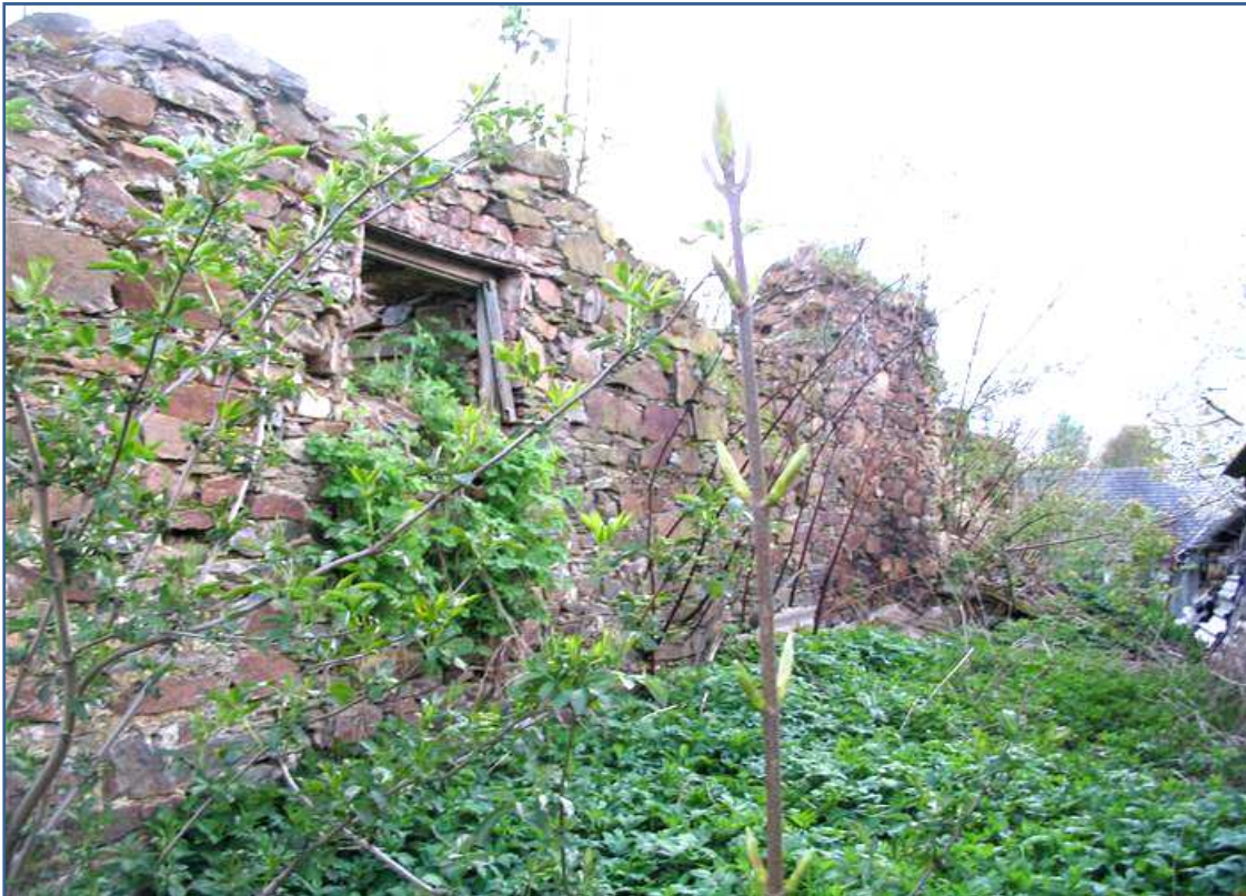
Bělá, zbytky středověké tvrze

V půdorysu čtvercová tvrz věžovitého typu stála uprostřed vsi na mírném návrší u rybníka. Chránila ji hradba s baštami v nárožích a příkopy. Ještě v 19. století zde stály z opevnění tvrze dvě okrouhlé bašty a příkopy kolem ní. Poslední bašta byla zbourána v roce 1881. V tomto roce také byly zavezeny příkopy. Tvrz byla definitivně rozbourána v roce 1894. Dodnes se dochovaly jen malé zbytky sklepů.