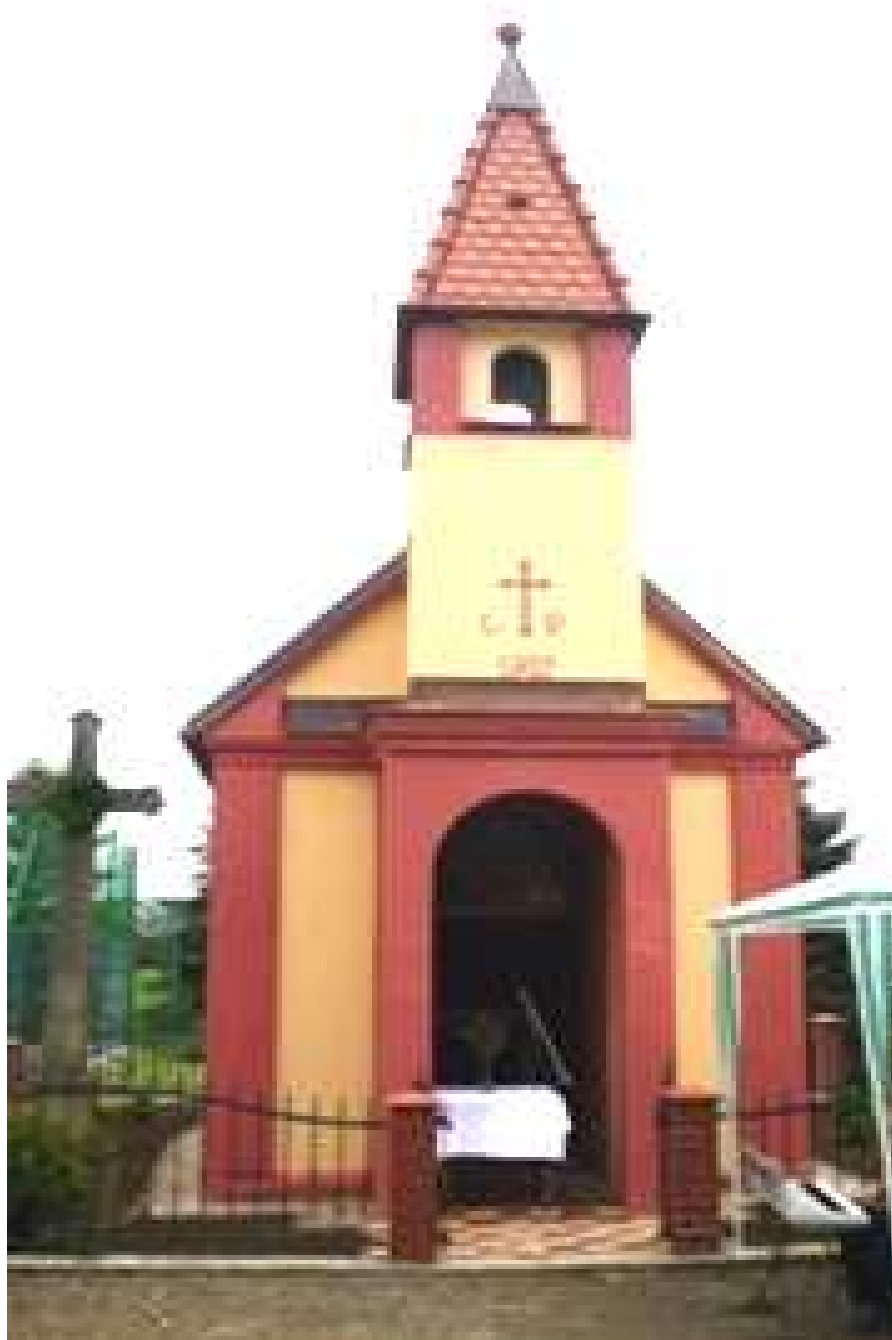
Bělá – Kaple Svatého Jana Nepomuckého