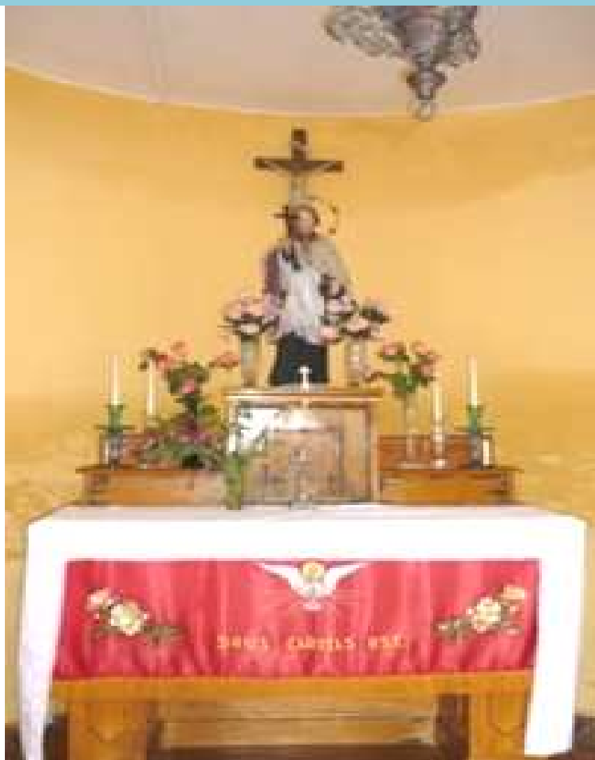
Bělá, oltář Sv. Jana Nepomuckého