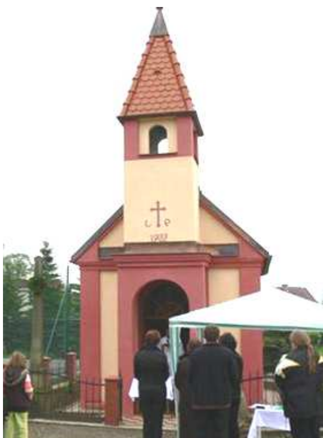
Kaple Svatého Jana Nepomuckého, znovuvysvěcení v květnu 2010

Kolem roku 1890 se hodně rodin vystěhovalo ze vsi do Ameriky za vidinou lepšího a bohatšího života. Ne všem se tam však dařilo dobře, někteří by se rádi vrátili