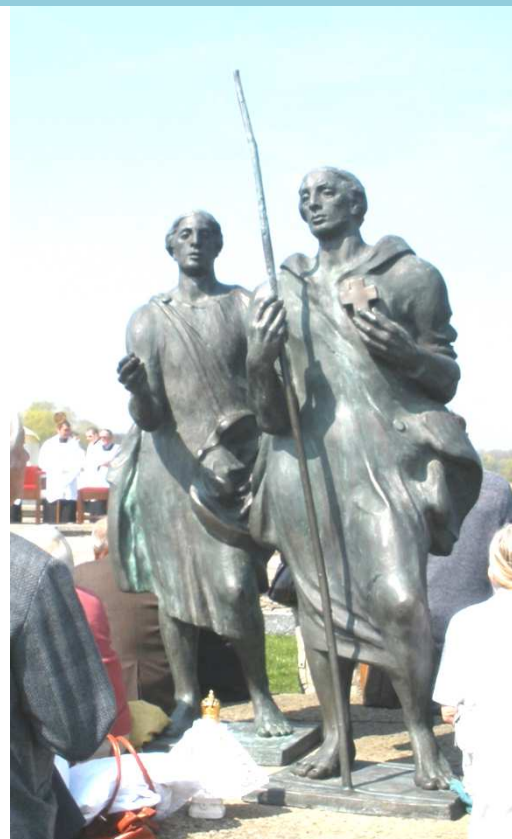
Libice, sousoší bratrů Sv. Vojtěcha a Radima

Poděbrady jsou krásným a příjemným městem, na kolonádě kvetly tulipány, narcisky a další jarní květiny, prožili jsme tam hezké odpoledne mezi turisty a návštěvníky, mezi pacienty a lázeňskými hosty, kteří si společně s námi také užívali jarního sluníčka. A.H.