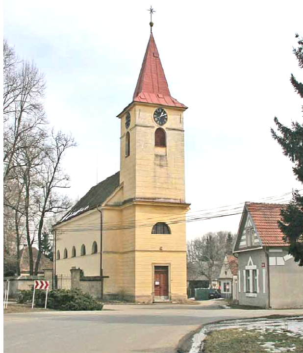
Kostel Svatého Vojtěcha v Libici