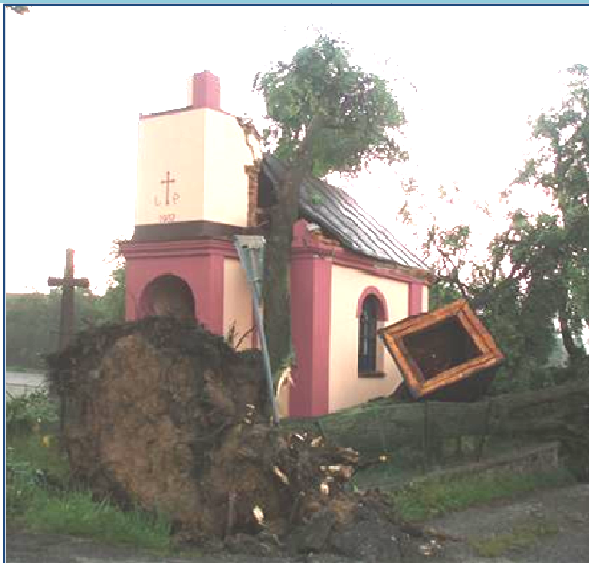
Bělá, poničená kaple větrnou bouří v r. 2008

V srpnu 2009 jsme začali s kompletní rekonstrukcí kaple. Stávající poškozená plechová střecha byla odstraněna a na místo ní byla provedena nová střecha opatřena pálenými taškami. Dále s ohledem na pronikající vlhkost byly vyměněny okapy a provedeny drenáže s odizolovaným okapovým chodníkem. Rovněž byly vyměněny veškeré výplně otvorů, stávající pozinkované klempířské prvky byly nahrazeny novými a došlo k opravě stávajících omítek a jejich opětovnému nátěru. Celou rekonstrukci pak završilo