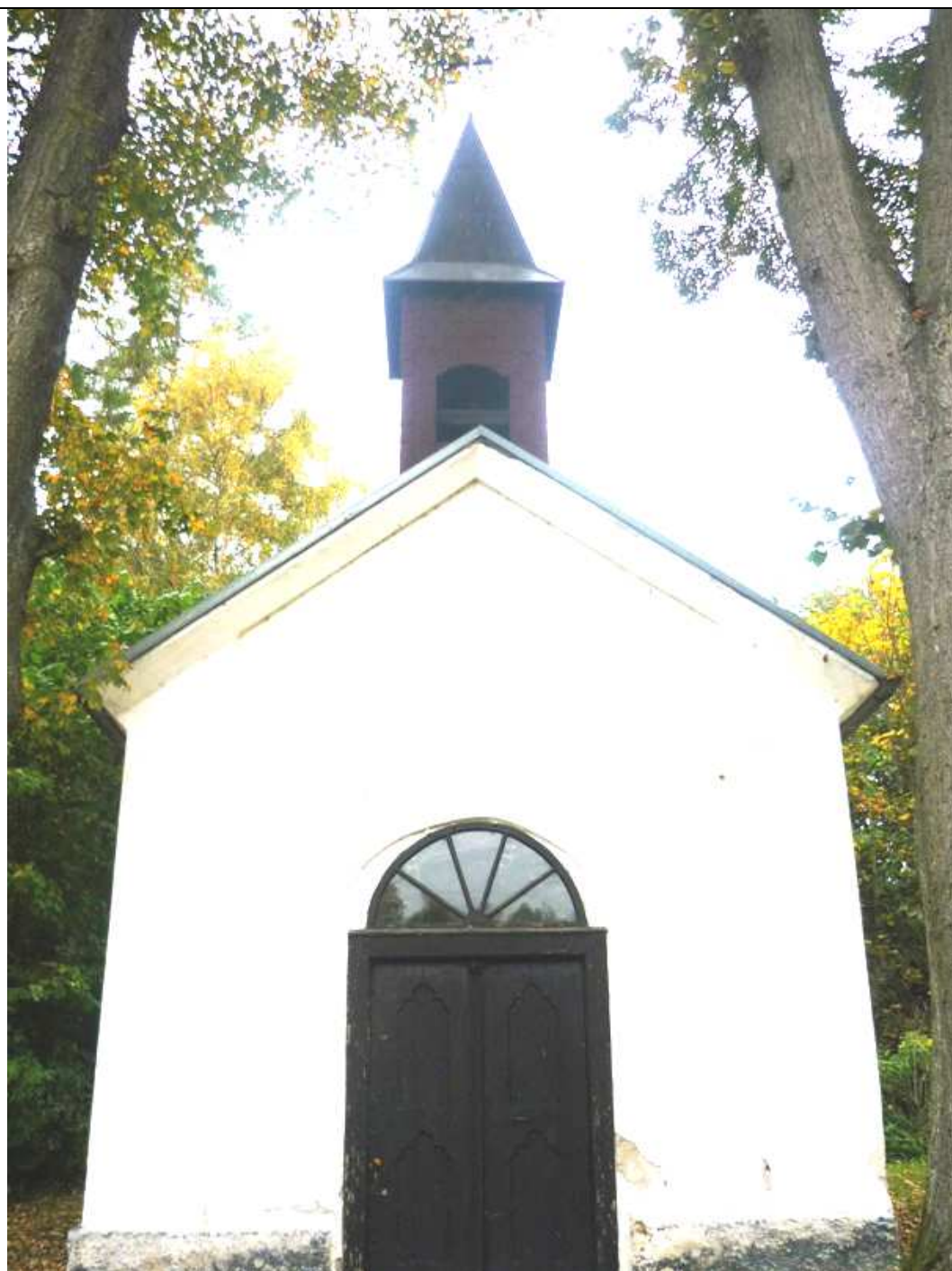
D Ě D I C E – Kaple svatých Petra a Pavla