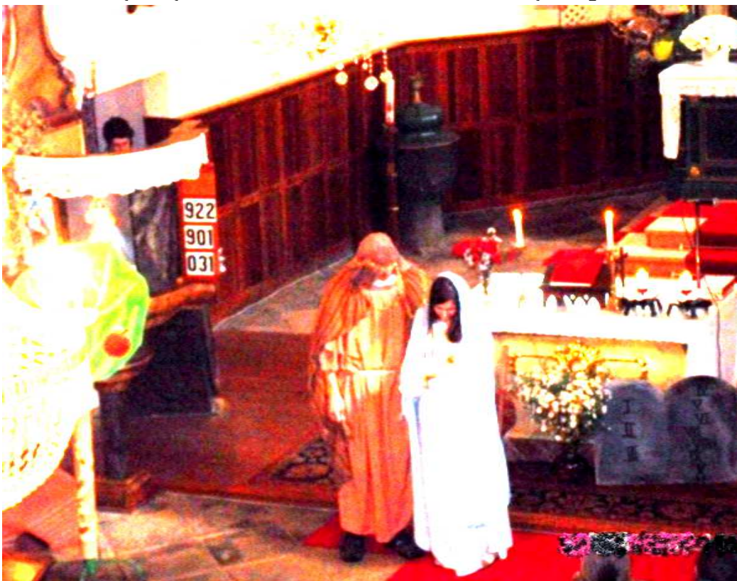
Narození Ježíška v Betlémě – obraz svaté rodiny

V neděli 7. listopadu k nám zavítaly děti a mládež z Divadelního spolku Archa při Farnosti-Děkanství v Ledči nad Sázavou s vystoupením Obrázky z Bible. Představení začalo ihned po závěrečném požehnání. Učinkující předstoupili na začátku v bílých rouchách a první z nich nesl Bibli, jako základ všeho na světě i tohoto představení. Poté jsme mohli vidět výjev Stvoření světa – Adama a Evu, strom s hadem z ráje, dále pak následovala Potopa světa – Noe se zvířaty, pak byl Mojžíš a Desatero, mohli jsme také spatřit Archu úmluvy, proroka Izajáše a poté již výjev Ježíška v Betlémě s Josefem a Marií. Následoval již dospělý Ježíš, jak káže učedníkům, Poslední večeře, Velký pátek a Golgota, dále pak obraz Vzkříšení a Ježíše zjevujícího se učedníkům, Ježíše jak posílá učedníky do světa kázat