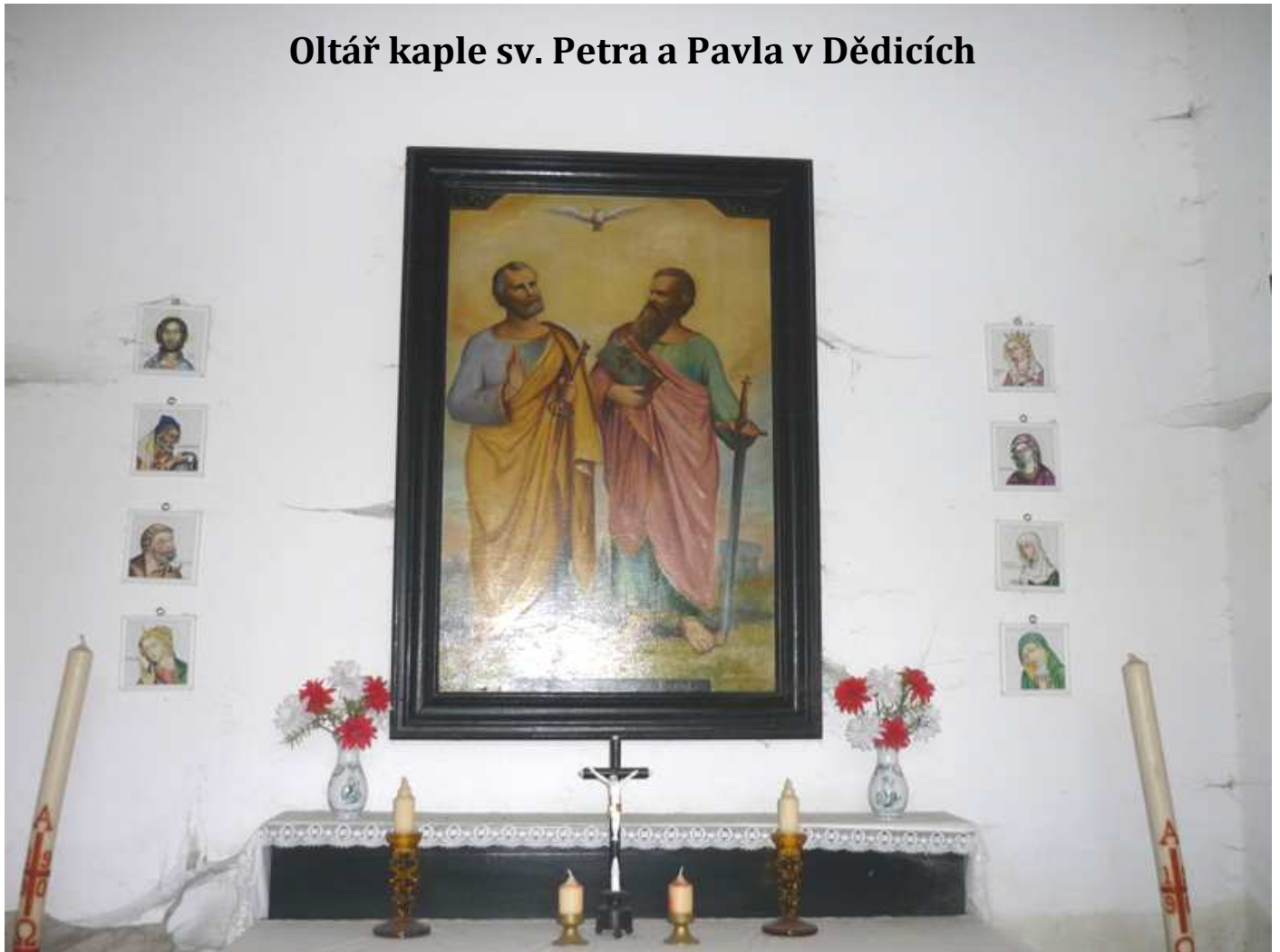
Oltář kaple sv. Petra a Pavla v Dědicích

Dalším místem v naší Farnosti je ves Dědice, která v od 1. 7. 1960 spadá pod obec Dobrovítov, kdy k němu byla připojena. Také historie Dědic je též úzce spojená s touto obcí. Historický lexikon obcí 2005 říká: „ DĚDICE v r. 1869 -1930 osada obce Hostkovice v okr. Čáslav, v r. 1950 osada obce Hostkovice v okr. Ledec nad Sázavou, v r. 1961-1992 část obce Zbýšov v okr. Kutná Hora, od 1.1.1993 část obce Dobrovítov v okr. Kutná Hora. “