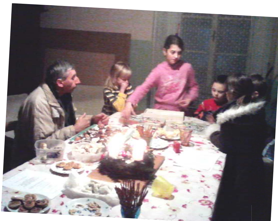
...a hra pokračuje, pan farář nakonec zvítězil!!!