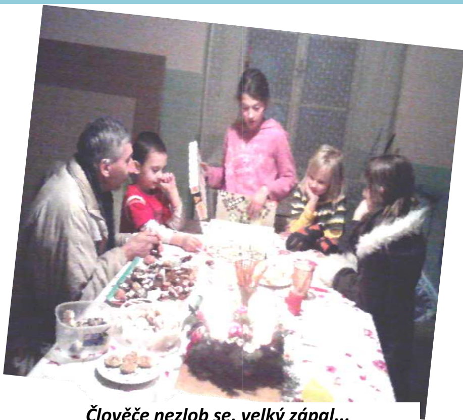
Člověče nezlob se, velký zápal...

a vánoční hudbu z přehrávače. Později k nám dorazily dvě mladé rodiny s dětmi, jejichž otcové a manželé jsou zaměstnáni v místní firmě, naposledy přišel pan farář, který se s námi modlil a děkovali jsme všichni za setkání, za společenství, pokrmy, dary a vše, co máme. Posezení probíhalo ve volné atmosféře povídání a konverzace, luštění tajenek s biblickou a vánoční tematikou, nebo společenskými hrami, pan farář si s dětmi zahrál Člověče nezlob se a vyhrál 😊. A tak jsme se ani nenadáli a setmělo se, postupně jsme se rozešli domů okolo 19.00. Prožili jsme hezký podvečer v příjemném společenství.